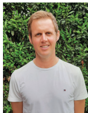
Thomas Beckmann Schwertransporte PB Gelsenkirchen