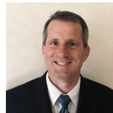
Jürgen Happel Betrieb und Verkehr Hamm, OKP