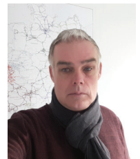
Ingo Weber Spezialvermessung PB Münster